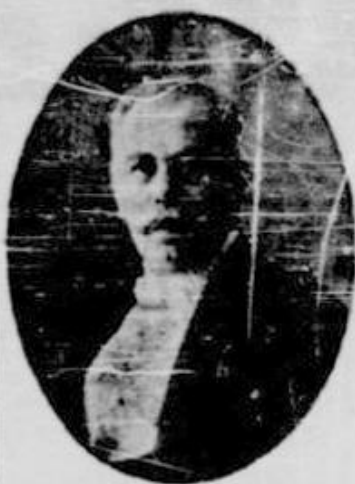
Mâine, Duminică 19 Iunie se va dezveli la Bazargie bustul marelui patriot și om de stat Nicolae Filipescu.

Solemnitatea va fi cinstită cu prezența P. S. S. Episcop N. Colan, ministrul Educației Naționale.