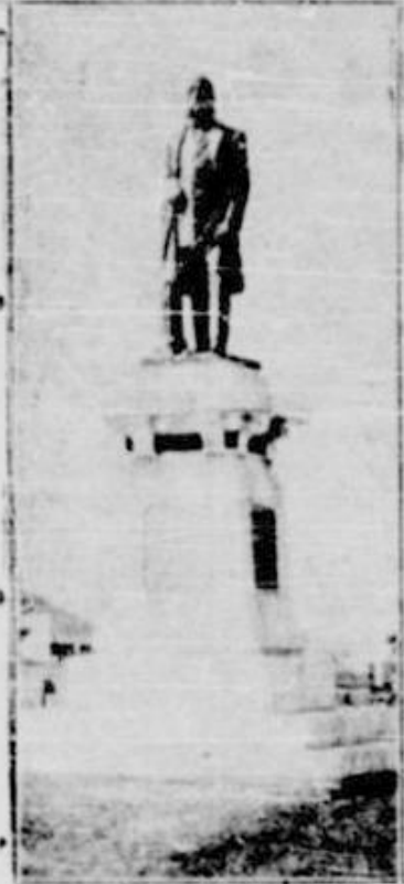
situată între lacul Tschirghiol și mare, deși într-o situație geografică din cele mai bune

Cea mai veche stațiune balneară de pe țărmul dobrogean al Mării Negre și cea care s'a impus totdeauna prin calitățile pe care le are, este Carmen Sylva